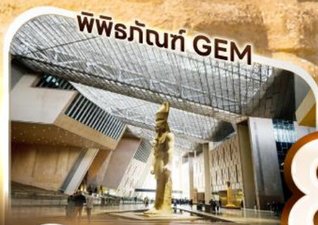
พิพิธภัณฑ์ GEM