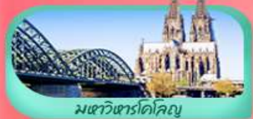
มเซวัวร์โคโลญ