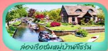
คลองเรือชมหมู่บ้านกังหัน