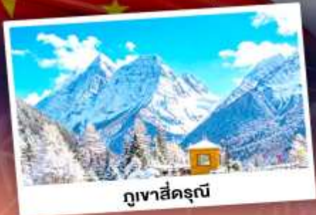
ภูเขาสี่ครุณี

เที่ยว 3 อุทยานแล้วรอดแห่งมณฑลเสฉวน ถ่ายรูปชิคอินน้ำพุไม่ไผ่ยักษ์ เดินเล่นถนนโบราณ