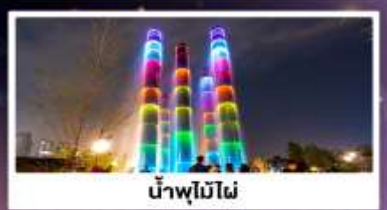
น้ำพุไม่ไผ่