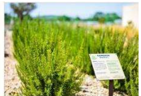
The Mediterranean Garden