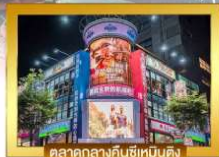
ตลาดกลางคินซีเหมินติง