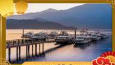
ทะเลสาบสุริยอันจินทรา