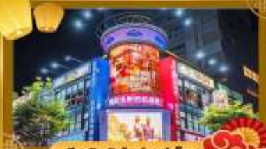
ช้อปปิ้งในไนท์มาร์เก็ต