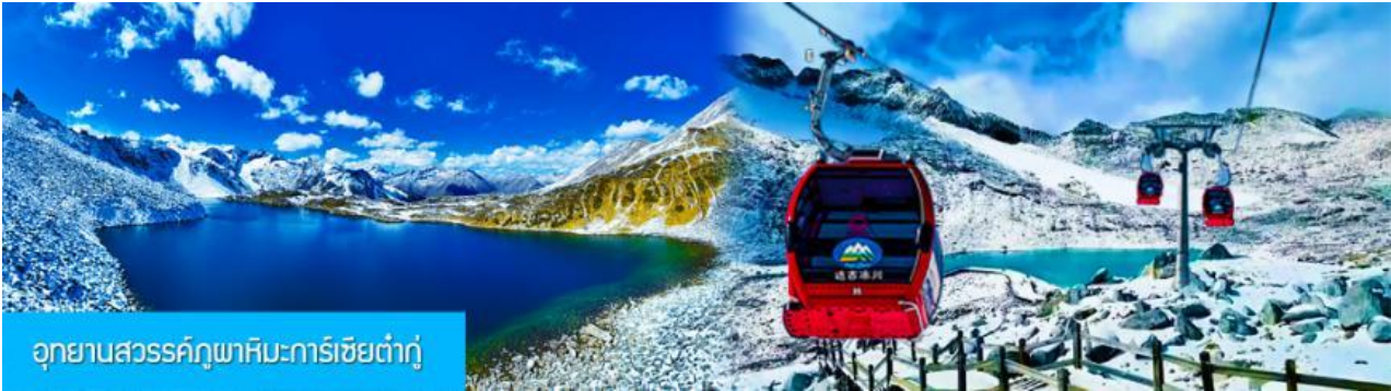
อุทยานสวรรค์ภูผาหิมะการ์เซียต้ากู่

พักที่ โรงแรม DAGU GLACIER HOTEL ระดับ 4 ดาวห้องถ้ำหรือเทียบเท่าใกล้อุทยานต้ากู่