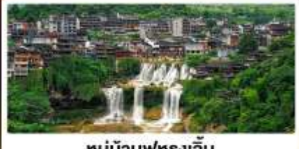
หมู่บ้านฟุทงเจิ้น