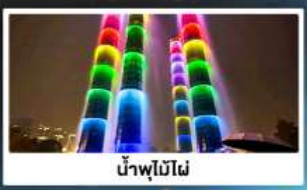
น้ำพุไม้ไฟ