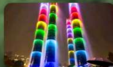
น้ำพุไม้ไฟ