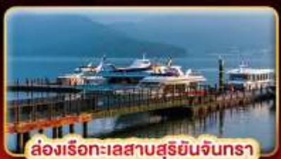
ล่องเรือทะเลสาบสุริยจันทร์

บ๊ี้แด้ม STREET FOOD แบบจุใจ ขอความรักวัดแดงชาแน