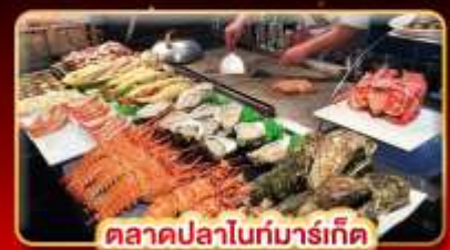
ตลาดปลาไถ่มาร์เก็ต