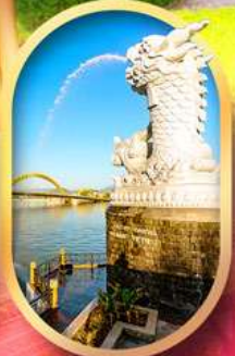
คาร์พดราท้อน