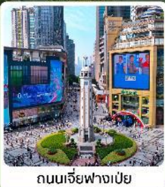
ถนนเจียฟางเป่ย์