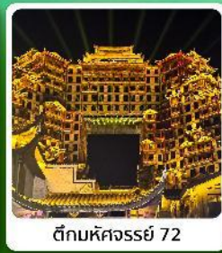
ตึกห้ศจรรย 72

• ไฮไลท์ อุทยานเทียนเหมินซาน ประตูสวรรค์ ตึกห้ศจรรย 72 หมู่บ้านโบราณฟูหลงจีน ภูเขาไร้ซาอู่เจียโต อุทยานซือจ้อกวนด่านสิงโต