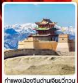
กำแพงเมืองจีนด่านเสี่ยววีกวน

• ไฮไลต์...เส้นทางสายไหม ชมสระน้ำวังพระจันทร์ ทะเลทรายหิ่งซาซาน กำแพงเมืองจีนด่านสุดท้าย "เจียยวีกวน" มรดกโลกภูเขาสายรุ้งจางเย่