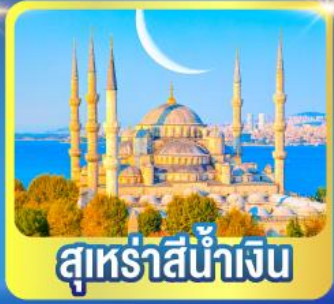
สุเหร่าสีน้ำเงิน