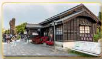
หมู่บ้านฮินกี้