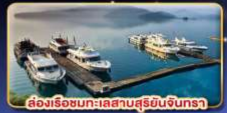
ส่องเรือชมทะเลสาบสุริยอันจินทรา