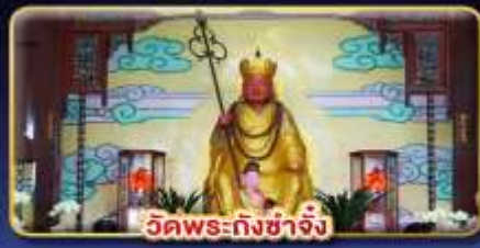
วัดพระกั๋งซาจิ้ง