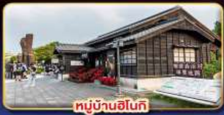
หมู่บ้านฮิน็อกิ

"ไทเป" มหานครแห่งเมืองสี่พัน เที่ยวจุใจ เช็กอินจุดไฮไลท์