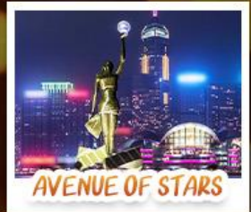
AVENUE OF STARS