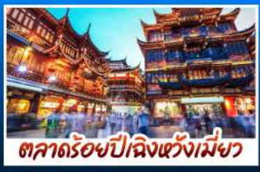
ตลาดร้อยปีฉางชิ่งเหมิงว