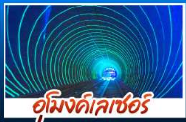
อูมิงดิลเลอร์