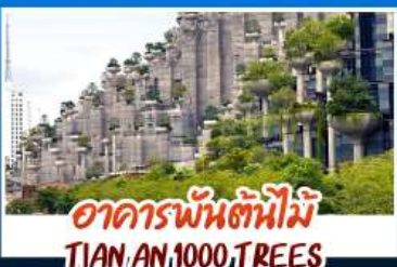
อาคารพันต้นไม้อูเทียน 1000 TREES