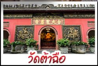
วัดต้าเอือ