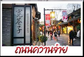
ถนนความจำ