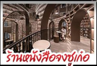
ร้านหนังสือจชช ก้อ

อุทยานภูเขาสี่ดรุณี อุทยานปี้เต็งโกว หมู่แพนด้าอนเซลฟี ร้านหนังสือจชช กวัดต้าเอือ ถนนโบราณความจำ ช้อปปิ้งย่านคิง ถนนไท่กู่หลี่ + ถนนซุนซี้ เมนูพิเศษ สุกี้หมาล่าเสวน