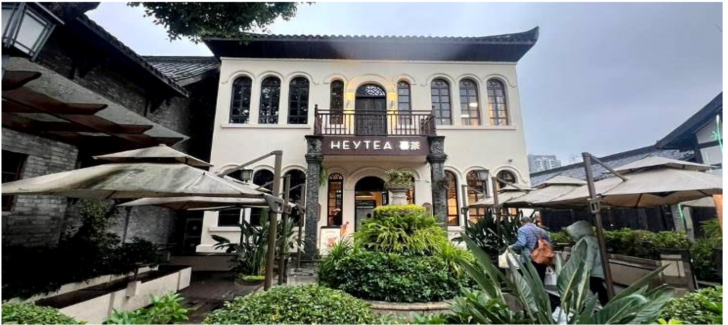
ที่พัก Xingchen Hangdu International Hotel หรือระดับเทียบเท่า 4 ดาว (มาตรฐานจีน)

วันที่ 5 เฉิงตู – ร้านหยก – วัดต้าเจี๋ย – ถนนคนเดินชุนซีลู่ – หมีแพนด้าปืดักIFS – ถนนไท่กู่หลี่ – สนามบินเฉิงตู (VZ3681 : 23.00 - 01.15+1) กรุงเทพฯ (สนามบินสุวรรณภูมิ)