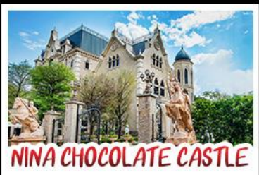
NINA CHOCOLATE CASTLE

ทะเลสาบสุริยจันทร - ไทเป 101 จิวเฟิน - NINA CHOCOLATE CASTLE MONSTER VILLAGE - ซีเหมินติง เมนูพิเศษ ปลาประจานาธิบดี เซี่ยวหลงเปา / ชาบูไต้หวัน