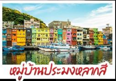
หมู่บ้านประมงเหลากสี