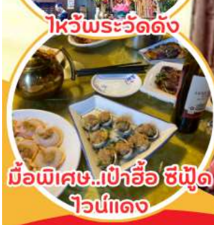
มือพิเศษ...เป่าอ้อ ซิฟูด ไวน์แดง