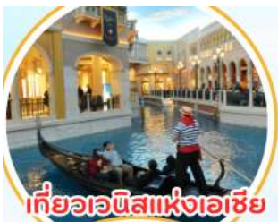
เที่ยวเวนิสแห่งเอเชีย