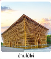
บ้านไม้ไผ่