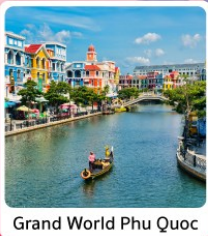
Grand World Phu Quoc