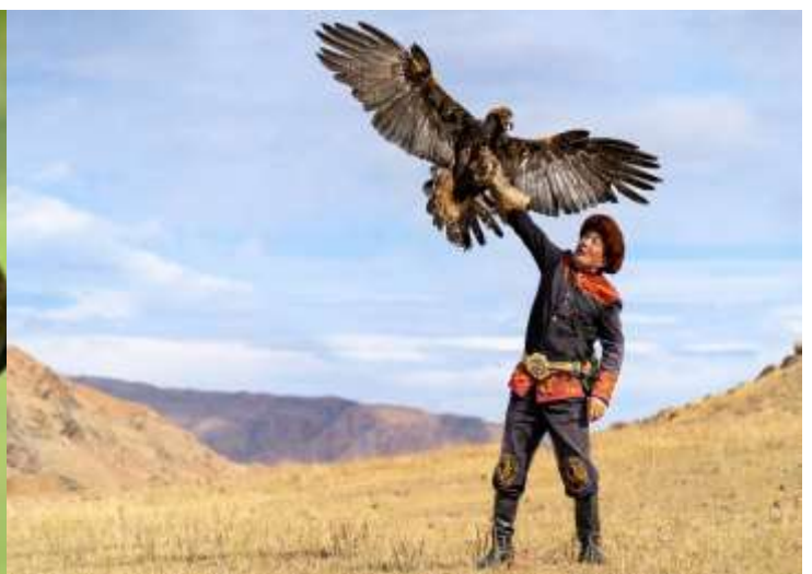
อินไตยาก

จากนั้นนำท่านเดินทางต่อไปยังที่พัก อิสระให้ทุกท่านได้ถ่ายรูปกับ Yurt ตามอัธยาศัย