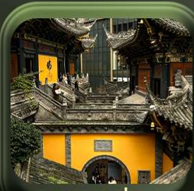
“ วัดหลัวอัน ”