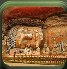
“ พาทินแกะสลักต้าจู้ ”

T2G-CKG26CZ Special of Chongqing...จงซิ่ง ต้าจู้ อุ้หลง อุทยานหลุมฟ้า เขานางฟ้า 5D 3N (CZ)