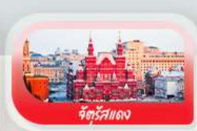
จัตุรัสแดง