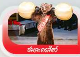
หมีคะครีส์ตี