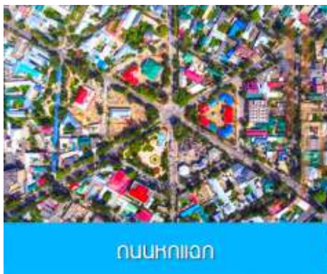
ถนนหกดอก

จากนั้นนำท่านเดินทางสู่ เมืองอิหนิง 伊宁 (ระยะทาง 200 กม. ใช้เวลาเดินทางราว 3 ชั่วโมง)