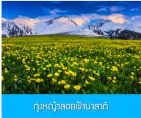
ทุ่งหญ้าลวยฟ้านาลาถิ

พักที่ WAN SEN HOTEL ระดับ 4 ดาวท้องถิ่นในตำบลนาลาถิ