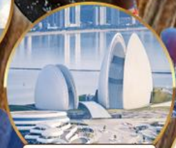
โรงแรมหรูไฮบูท