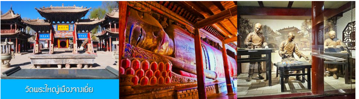
วัดพระใหญ่เมืองจางเยี่ย

รับประทานอาหารเช้า ณ ห้องอาหารของโรงแรม (15)