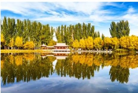
อุทยานจิวเจี๋ยนแห่งราชวงศ์ฮั่น

จากนั้นนำท่านเดินทางสู่เมืองจิวเจี๋ยน (ระยะทาง 50 กม. ใช้เวลาเดินทาง 1 ชั่วโมง)