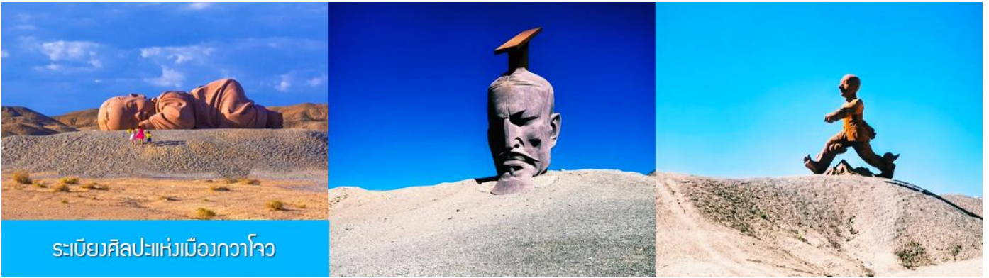
ระเบียบศิลปะแห่งเมืองกวาโจว