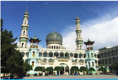
มัสยิดเมืองตงกวน