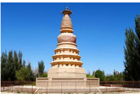
เจดีย์ม้าขาว

เที่ยง รับประทานอาหารกลางวัน ณ ภัตตาคาร (10)