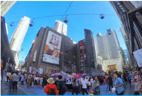
ย่านการค้าและถนนคนเดินลี่เหมิง