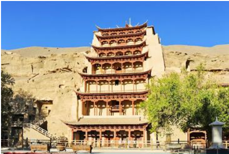
ถ้ำหินมั่วเกาถู

เช้า รับประทานอาหารเช้า ณ ห้องอาหารของโรงแรม (9)