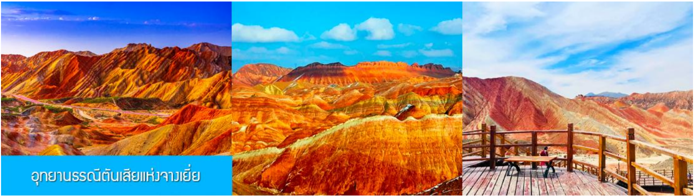
อุทยานธรณีดินสีแห่งจางเยี่ย