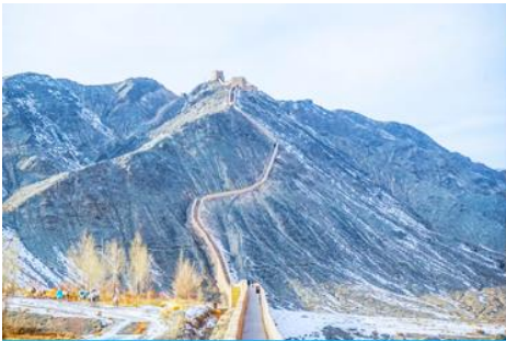
กำแพงเมืองจีนเสวียนปี้