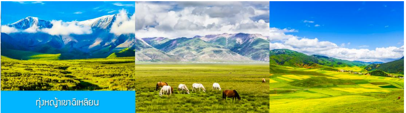
ทุ่งหญ้าฉีเหลียน

จากนั้นนำท่านเดินทางโดยรถบัสสู่ทุ่งหญ้าฉีเหลียน (ระยะทาง 140 กม. ใช้เวลาเดินทางประมาณ 2 ชั่วโมง)