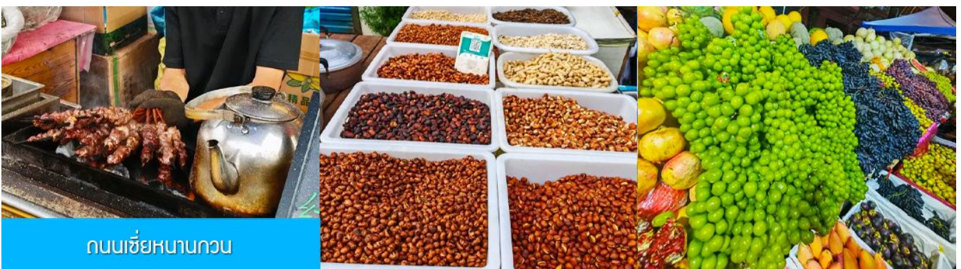
ถนนเซี่ยหนานกวน

หลังอาหารนำท่านเดินทางโดยรถบัสสู่ เมืองซีหนิง 西宁 (ระยะทาง 289 กม. ใช้เวลาเดินทางราว 3 ชั่วโมงเศษ)