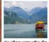
ห้องเรือทะเลสาบเทียนฉือ

เส้นทางสายไหม เริ่มต้นเพียง 56,999 FREE VISA