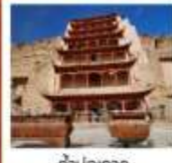
ถ้ำม่อเกากู