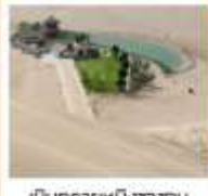
เมืองกรวยหงษ์ซาซาน