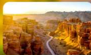
Charyn Canyon+Black Canyon