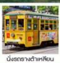
นั่งรถรางต้าเหลียน