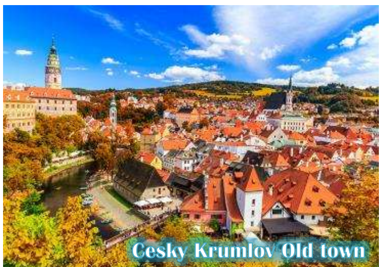
Cesky Krumlov Old town

บ่าย นำท่านเดินทางสู่ “เมืองเชสกี้ ครุมลอฟ (เมืองมรดกโลก)” เป็นเมืองขนาดเล็กในภูมิภาคโบฮีเมียใต้ของสาธารณรัฐเช็กมีชื่อเสียงจากสถาปัตยกรรมและศิลปะของเขตเมืองเก่าและปราสาทครุมลอฟ ที่ยังคงมีเสน่ห์เหมือนอยู่ในเทพนิยายมาจนถึงทุกวันนี้ และน่าจะเป็นเมืองที่สวยงามที่สุดในสาธารณรัฐเช็ก, เชสกี้ ครุมลอฟได้รับการจัดอันดับให้อยู่ในสิบเมืองที่สวยงามที่สุดในโลก เป็นหนึ่งในสถานที่ที่สวยงามที่สุดและไม่ควรพลาดในการเดินทางไปสาธารณรัฐเช็ก เดินเล่นไปบนถนนในยุคกลาง ปราสาทสไตล์บาโรกที่ไม่บุบสลาย และแม่น้ำที่คดเคี้ยว เมืองเก่าที่งดงามแห่งนี้ได้รับการอนุรักษ์ไว้อย่างดีจากอดีตและการทิ้งระเบิดในสงครามโลกครั้งที่ 2 ทั้งหมดทำให้เมืองที่มีทิวทัศน์แห่งนี้รู้สึกเหมือนอยู่ในเทพนิยายจากยุคกลางสู่ความเป็นจริง