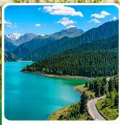
อุทยานเทียนชาน เทียนฉือ