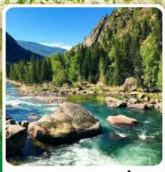
อุทยานเคอเคอทั้วไผ่