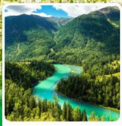
ทะเลสาบคานาสีอ