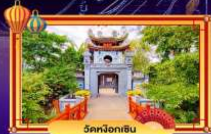
วัดผิงอิซิน