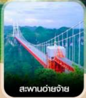
สะพานอ้ายจ้าย