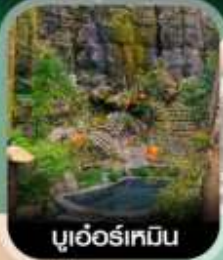
บูเออร์เหมิน