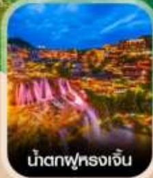
น้ำตกผู่หลงเจิน

สัมผัสสายหมอกแห่งขุนเขา สะพานอ้ายจ้าย แบบพารานามา แช่น้ำพุร้อนกลางธรรมชาติ อุทยานป่าไม้บูเออร์เหมิน ชมความอลังการ น้ำตกพันปี หมู่บ้านโบราณผู่หลงเจิน