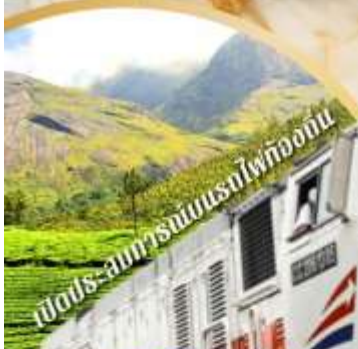
เปิดประสบการณ์รถไฟท้องถิ่น