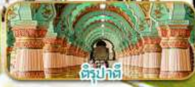
ติรุปาตี