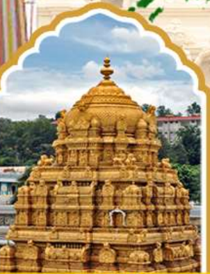
ตริปุรัต