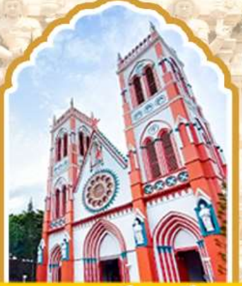
ปอนดีเชอร์