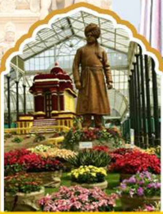
บังกาลอร์