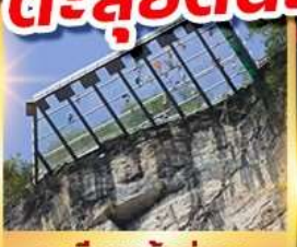
ระเบียงแก้วอุ๋หลง