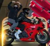
ถ่ายวีดีโอนั่งมอเตอร์ไซด์

ชิมหม้อไฟหม่าล่า นั่งรถรางชมธรรมชาติ หวาดเสียวระเบียงแก้ว