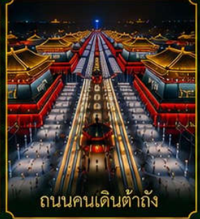
ถนนคนเดินต้าถัง