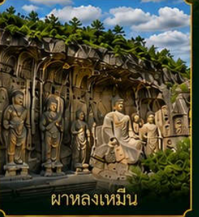
ผาหลงเหมิน