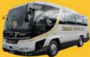
Bus (10-20 ท่าน)

➔ สำหรับท่านที่ต้องการความเป็นส่วนตัวมากขึ้น ท่านสามารถเลือกใช้บริการ รถส่วนตัวได้โดยมีรูปแบบรถให้เลือกถึง 3 ประเภท โดยรถ แต่ละประเภทสามารถนั่งได้ตั้งแต่ 2 ท่านขึ้นไป