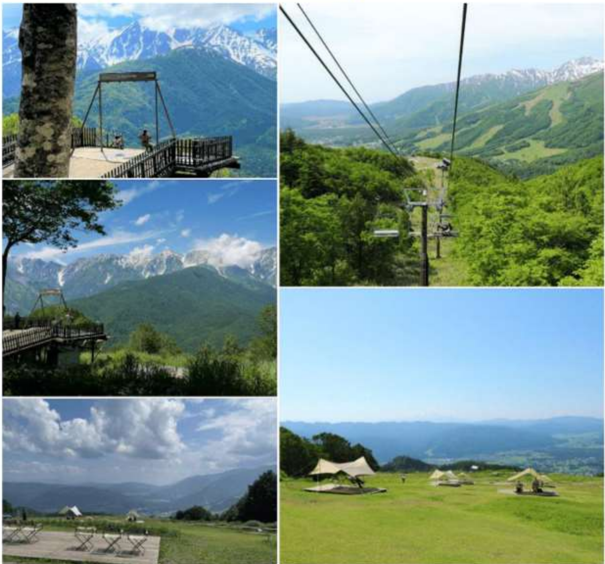
รูปภาพใช้เพื่อประกอบการโฆษณาเท่านั้น

นอกจากนี้ยังมี Yoo-Hoo! Swing ซิงช้าลอยฟ้าขนาดใหญ่ที่สามารถชมวิวสวย ๆ ไปพร้อมกับแกว่งชิงช้าแบบหันหน้าเข้าหาธรรมชาติบนเทือกเขาสูง ( ราคาทัวร์ไม่รวมค่าชิงช้า ) นอกจากนี้ท่านยังสามารถ นั่งกระเช้าห้อยขา Ski lift เพื่อลงไปยัง ฮาคูบะ ฮิโตโตกิ โน โมริ (Hakuba Hitotoki no Mori) ลานบริเวณกว้างที่มีร้านอาหารเชียวรสชาติดี Chavaty Hakuba ร้านคาเฟ่บรรยากาศดีอีกแห่งนั่งคอยให้บริการท่าน พลาดไม่ได้กับเครื่องเล่นที่จะทำให้ท่านได้เห็นทัศนียภาพที่สวยงามพร้อมทั้งความตื่นเต้นกับ Hakuba Giant Swing ซิงช้าขนาดใหญ่สูงเหนือพื้น 10 เมตร สามารถเหวี่ยงตัวไปข้างหน้าได้สูงสุดประมาณ 6 เมตร “หมายเหตุ การเปิดให้บริการของชิงช้าขึ้นอยู่กับสภาพอากาศ ณ วันเดินทาง และการปิดซ่อมบำรุงของชิงช้าโดยไม่ได้แจ้งให้ทราบล่วงหน้า”