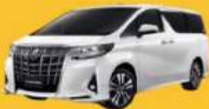
Alphard (2-4 ท่าน)