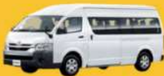
VAN (2-8 ท่าน)