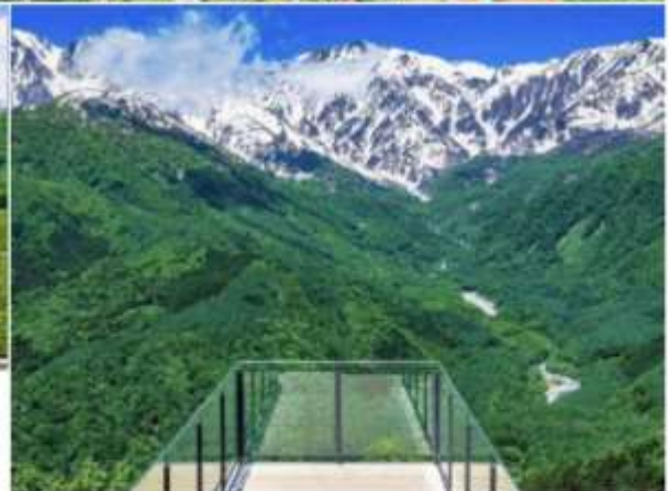
HAKUBA MOUNTAIN HARBOR THE CITY BAKERY