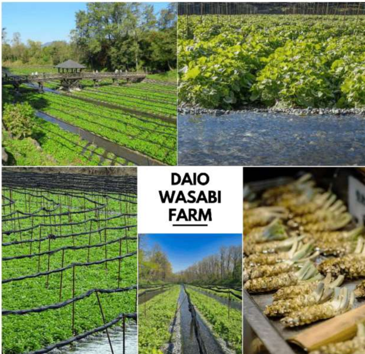
รูปภาพใช้เพื่อประกอบการโฆษณาเท่านั้น

เพื่อนำท่านสู่ ไดโอะวาซาบิฟาร์ม (Daio Wasabi Farm) เป็นไร่วาซาบิที่มีขนาดใหญ่ที่สุดในประเทศญี่ปุ่น ที่มีจึงกินพื้นที่ทั้งหมด 150,000 ตารางเมตร ซึ่งกรรมวิธีในการผลิตวาซาบินั้น ค่อนข้างที่จะซับซ้อน และพิถีพิถันมากเลยทีเดียว เริ่มจากสถานที่ในการปลูกต้นวาซาบิต้องปลูกในที่ที่น้ำใสสะอาดไหลผ่านเท่านั้น ที่มีจึงเหมาะสมมาก เพราะมีน้ำที่ไหลมาจากเทือกเขาแอลป์แปป (North Japan Alps) ไหลผ่านตลอด แคมเต็มเปี่ยมไปด้วยแร่ธาตุสำคัญ ถือเป็นปัจจัยหลักที่ทำให้วาซาบิของที่นี่คุณภาพดี นอกเหนือจากการเที่ยวชมฟาร์มวาซาบิแล้ว วิถีชีวิตของที่นี่ยังไม่เป็นรองใคร เพราะล้อมรอบไปด้วยเทือกเขาแอลป์แปป ท่านจะได้เห็นธรรมชาติแบบ 360 องศา สามารถมาเที่ยวได้ทุกฤดู ใช้เวลาเดินทางประมาณ 1 ชั่วโมง