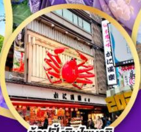
ซ้อปั้งชินโซบาช