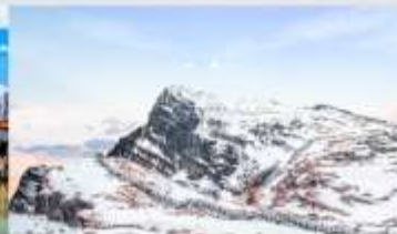
ภูเขาหิมะเจี้ยวจื้อ