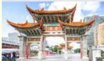
ประตูม้าทองโก่หยก