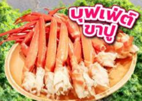
บุฟเฟ่ต์ ซาซึ