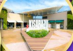
มิตซูเอะอิซากะลีต พาร์ค คิซะระชู