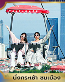
บั้งกระเช้า ชมเมือง