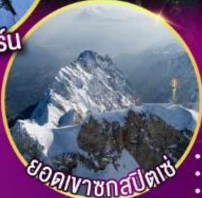
ยอดเขาชุกสปีตซ์