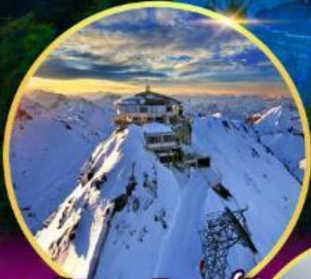
ยอดเขาซิลรอร์น