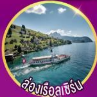
ล่องเรือลูซิเิร์น