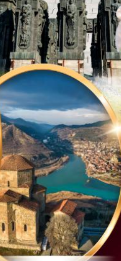
อารามจวารี

ทบิลีซี มิทสเคต้า คาซเบกกี กูดาอูรี กอริ อัฟลิสต์ซึเคห์ คูไตซี บากูมิ