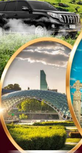
สะพานมิตรภาพ

*ราคาเริ่มต้น ไข่ - กลับ ต่อ 1 ท่าน เชื้อไขเป็นไปตามที่กำหนด