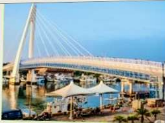
สะพานคู่รักตั้นสุ่ย