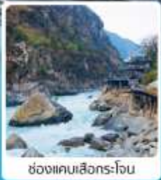
ช่องแคบเสืองกรโงน