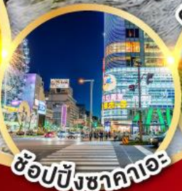
ช้อปปิ้งซากาคาเอะ