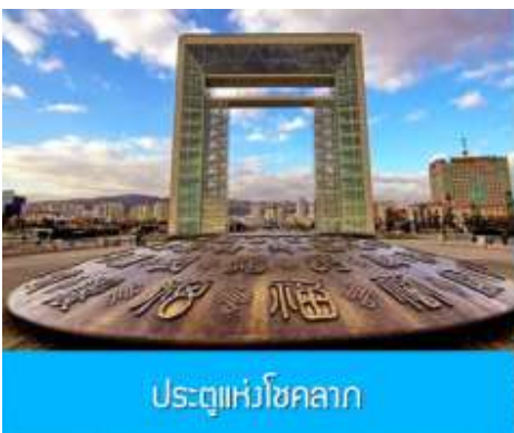
ประตูแห่งโชคกลาง