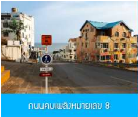
ถนนคอบเพลิงหมายเลข 8

นำท่านชมสวนสาธารณะเวย์ไห่ 威海公园 สวนสาธารณะริมทะเลที่ใหญ่ที่สุดของเมืองเวย์ไห่ ให้ท่านชมและถ่ายภาพคู่กับ กรอบรูปยักษ์วิวทะเล 威海公园大相框 แลนด์มาร์คที่เป็นอีกหนึ่งไฮไลท์ที่ฮิตของเมืองเวย์ไห่